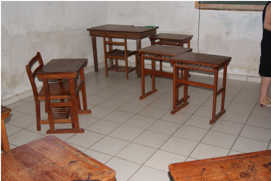
Local que, segundo a Direção, serve como sala de aula