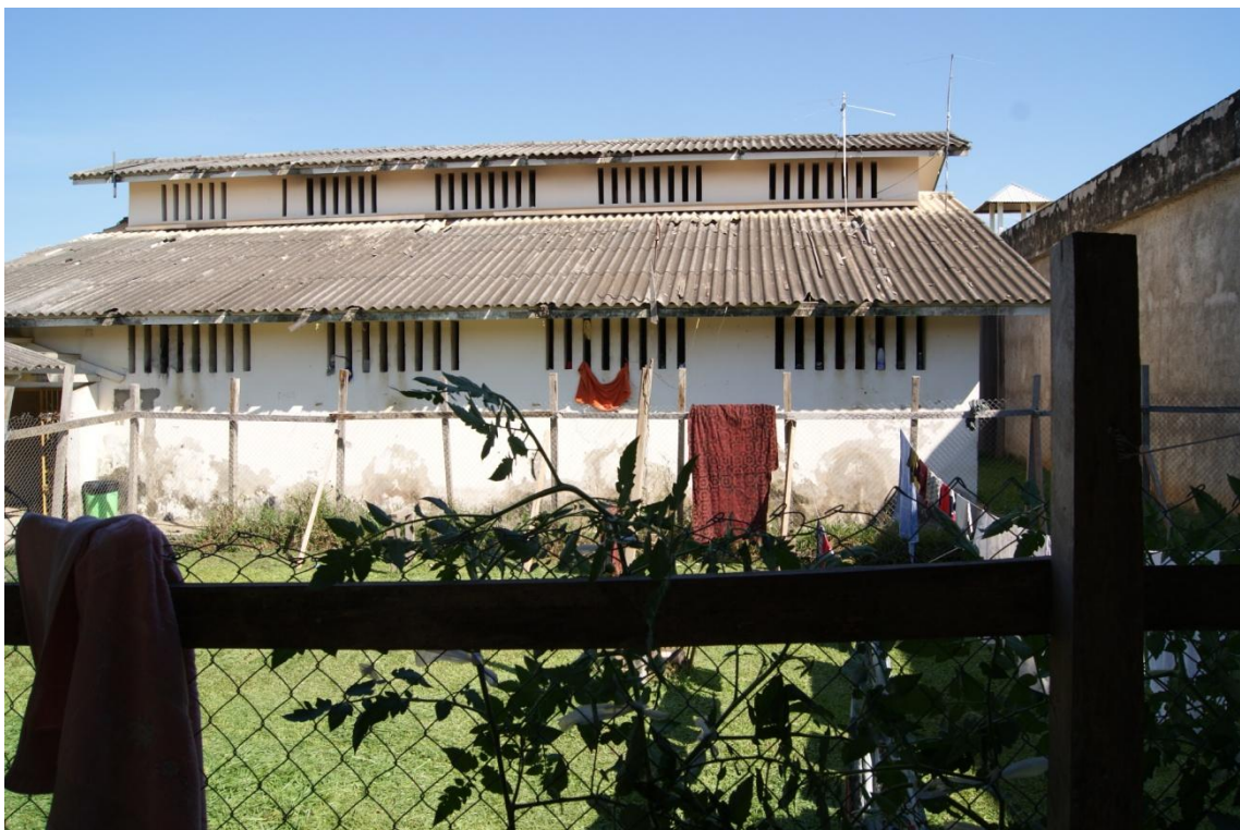
Visão externa da unidade