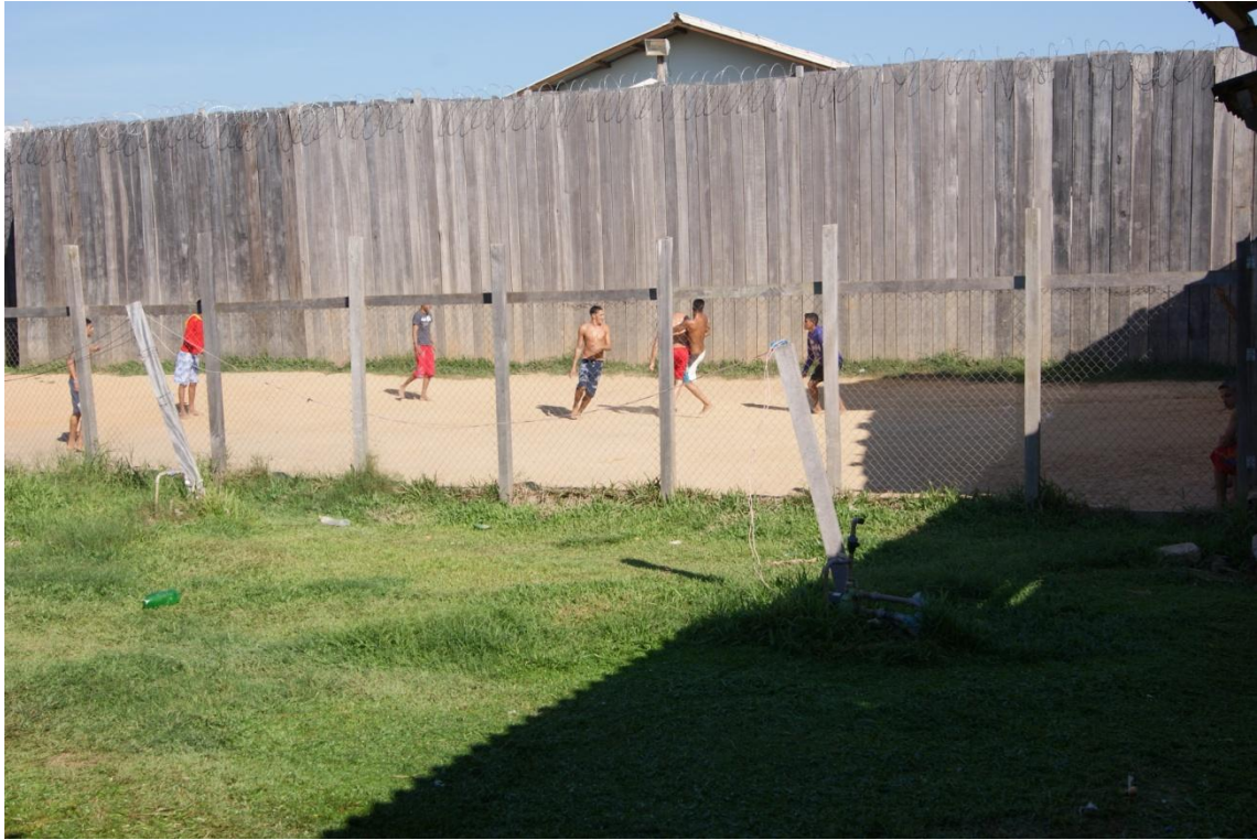
Pequena área externa, utilizada como banho de sol e cercada com muro de madeira e tela de arame liso