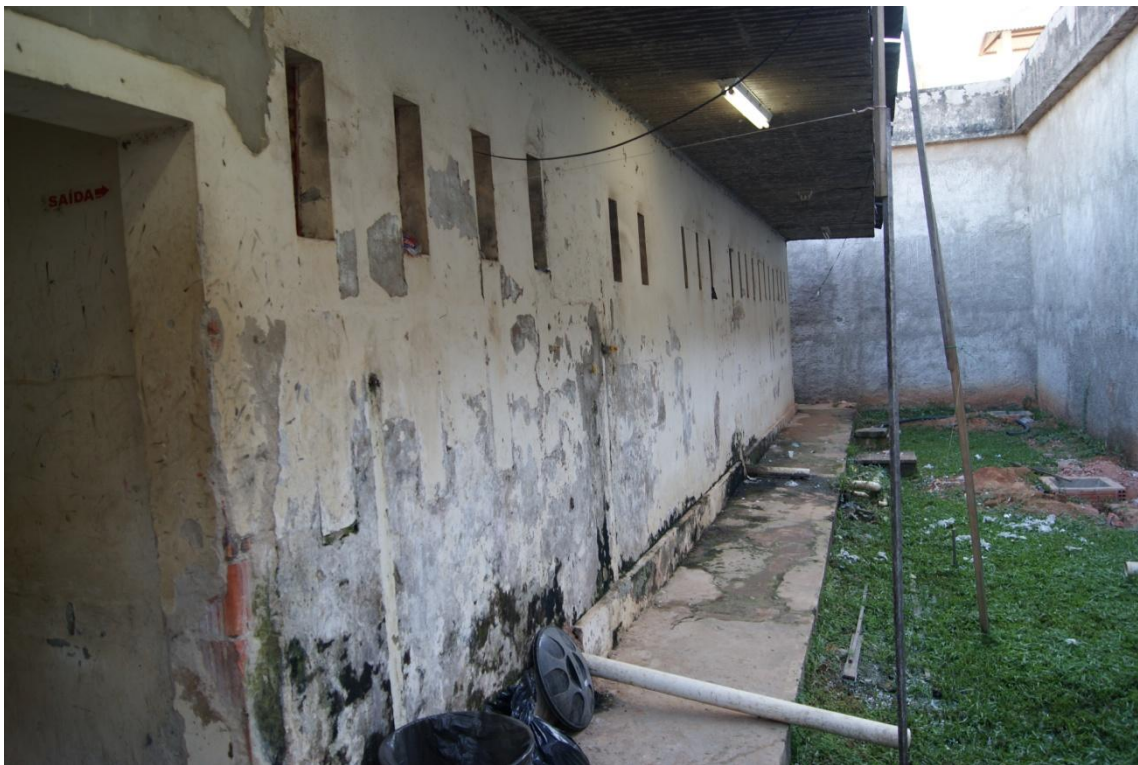
Visão externa – má conservação e lixo