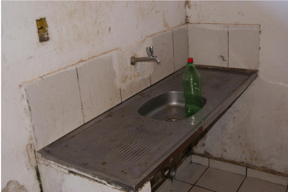
Sujeira e má conservação