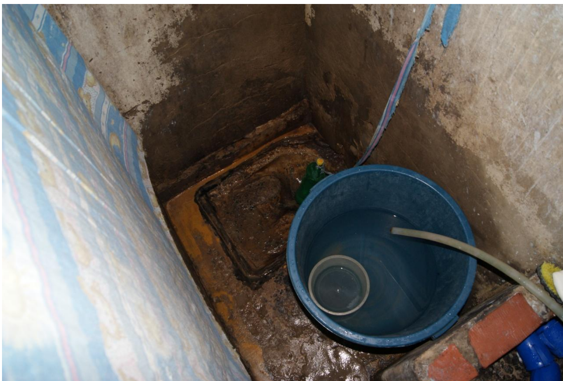
Situação de precariedade dos banheiros das celas